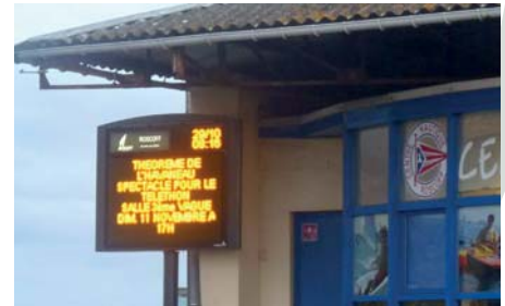
▲ Le panneau électronique d'information est situé près du Centre Nautique

Le règlement et formulaire de demande d'utilisation du panneau électronique sont disponibles à l'accueil de la mairie et sur le site de la ville www.roscoff.fr .