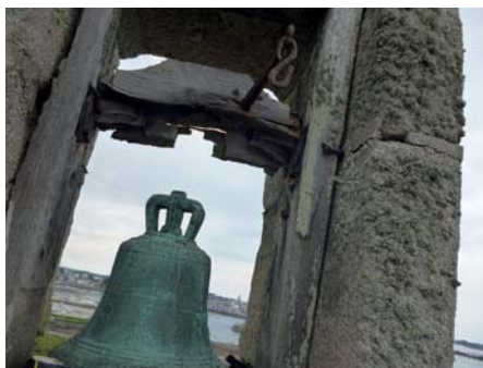
▲ Le clocher de la chapelle va être rénové

En raison de sa vétusté, le plancher intérieur a été renouvelé. Le clocher extérieur va également être rénové durant le mois de novembre (maçonnerie et reconstruction du support de cloche).