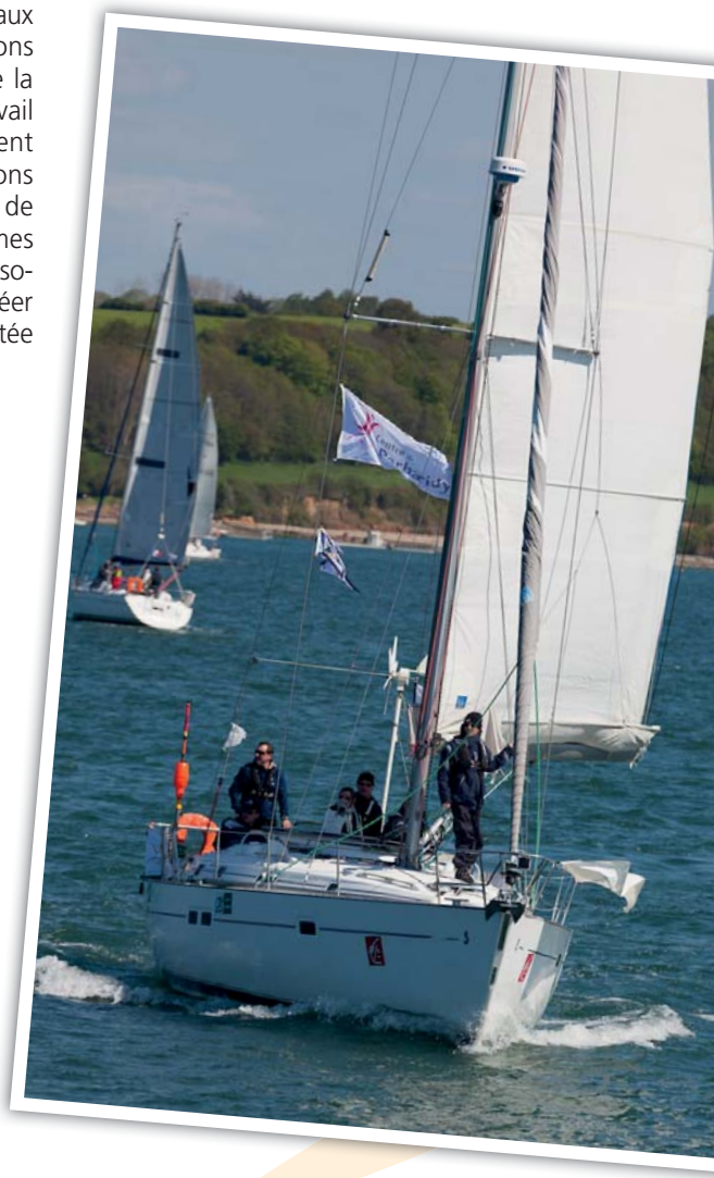
Le centre de Perharidy participe ▲ depuis cette année à la Tresco