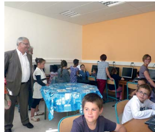
▲ Salle après les travaux