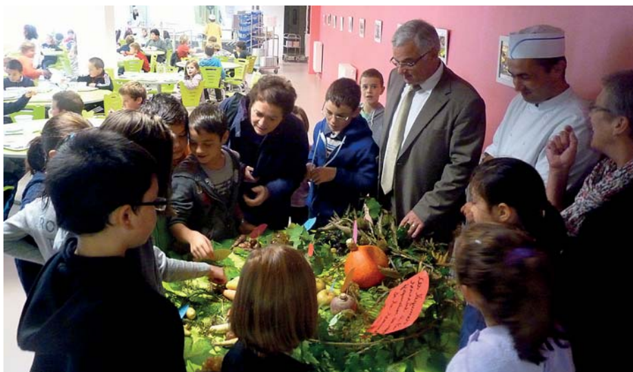
▲ Atelier découverte pour les enfants déjeunant au restaurant scolaire

La Semaine du Goût s'est déroulée en octobre dernier. Depuis plus de 20 ans, ce rendez-vous a pour ambition de faire redécouvrir la variété des saveurs au public et aux enfants, transmettre une passion pour les métiers de bouche et encourager les consommations durables.