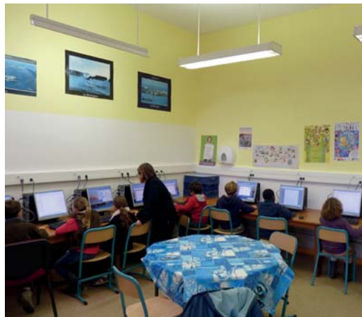
▲ Salle avant les travaux