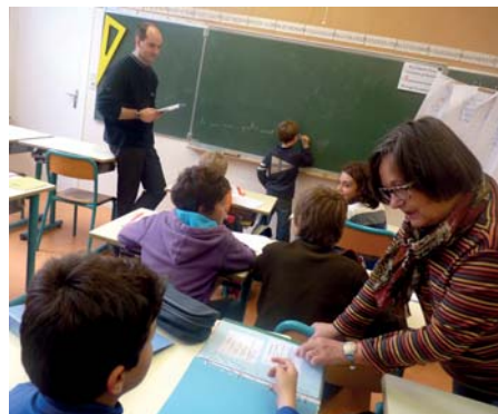
▲ Chaque bénévole prend en charge quelques élèves

Vous souhaitez être bénévole ? Contactez le service enfance jeunesse au 02 98 19 31 31