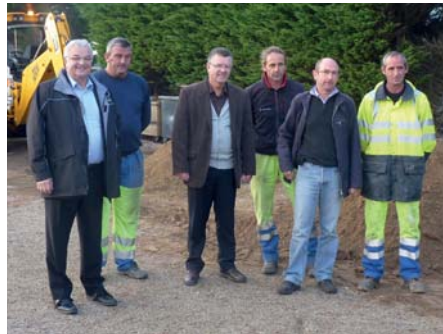
▲ Les élus et agents de la commune poursuivent leur objectif : zéro phyto !

Pour diminuer cet usage, les services des espaces verts ont procédé à l'engazonnement de 1000 m 2 au cimetière de Kermenguy afin de réduire les surfaces à désherber.