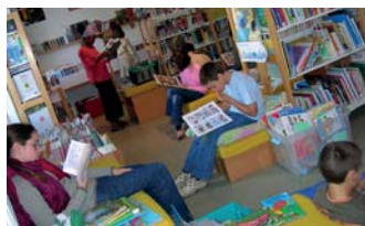
▲ La bibliothèque de Roscoff est appréciée des usagers

Un questionnaire a été mis à la disposition des lecteurs afin qu'ils puissent donner leurs avis sur le service. 184 lecteurs ont répondu à l'enquête menée par la commune au mois de mars dernier. Les lecteurs sont satisfaits des locaux, de l'accueil et du choix de livres proposés. Certaines personnes souhaiteraient que les horaires d'ouverture soient plus larges et que l'offre en musique et en DVD soit plus importante. Ils seraient également intéressés par des moments d'animations au sein de la Bibliothèque (rencontre avec des auteurs, conférence, lecture de conte...). Les lecteurs ont pu également, à travers cette enquête, demander certains ouvrages non disponibles encore pour le moment. L'état des lieux est satisfaisant, des améliorations sont à apporter même si le service est bien apprécié.