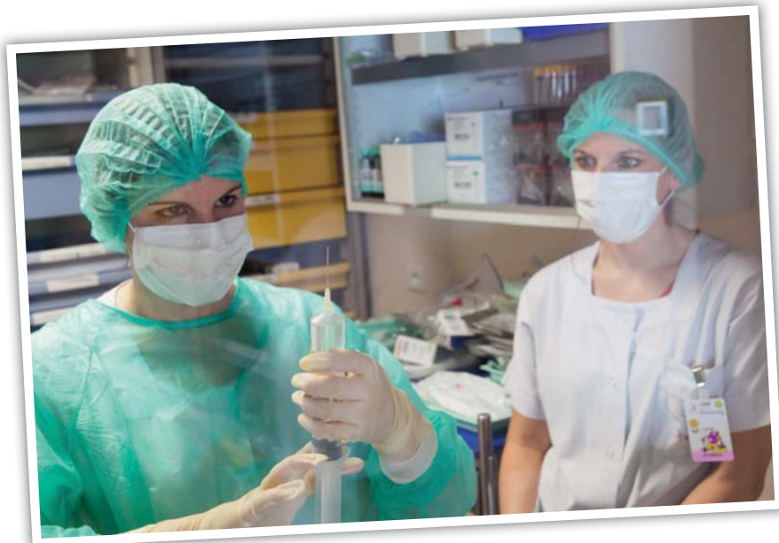
▲ 600 personnes travaillent au centre, plus de 80 métiers sont représentés